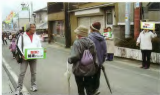
通る人たちへ呼びかけ